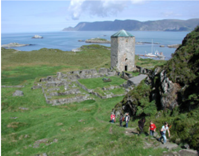
Øya Selja med ruinene av Benediktinerklosteret St. Albanus og stien til Mikaelshulen.

mørket, over havet er hun kommet til en solgrønn ø i vest. Hun ville bo hos oss og skal aldri forlate oss. Hun har født sitt barn i vårt hjerte, og den som nærer dette barn i sitt