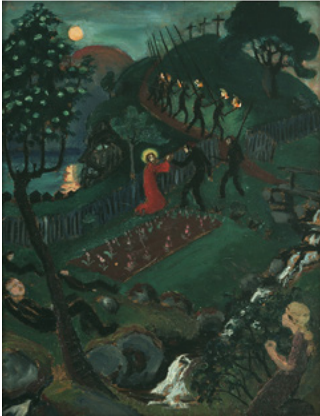
Nikolai Astrup: Getsemane (1926). Olje på plate 42x32cm. Bergen Kunstmuseum.

Hovudhuset. Astrupfamilien dyrket det meste de trengte, her på gården, og det ble anlagt terrasser for å holde jorda på plass. Rabarbraen gror vilt og frodig, akkurat som i Astrup sine bilder.