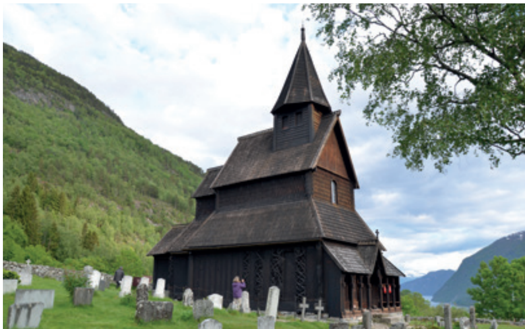
Urnes stavkirke ligger på odden Ornes i Lustrafjorden, en arm av Sognefjorden.

kraftig konveks tueform som antyder at noe hvelver seg fra det indre av jorden.