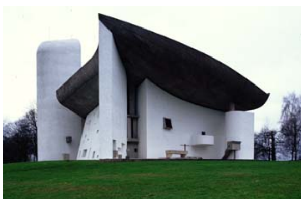
Kapellet «Vår Frue på Høyden» stod ferdig i Ronchamp, Frankrike i 1955, tegnet av den sveitsiske arkitekten Le Corbusier. Han besøkte det andre Goetheanum i 1927, idet betongarbeidet sto ferdig.