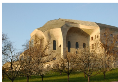
Branntomten fra det første Goetheanum 1922/1923. Modellen Steiner utformet og det ferdige bygget.