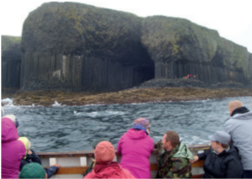
Ankommer Staffa med båt.

plate, og jeg gjenkjente musikken jeg hadde hørt der i båten utenfor grotten! Det var den berømte ouverturen «Die Hebriden» av Felix Mendelssohn. Det var som å sitte der, henført, utenfor hulen igjen.»