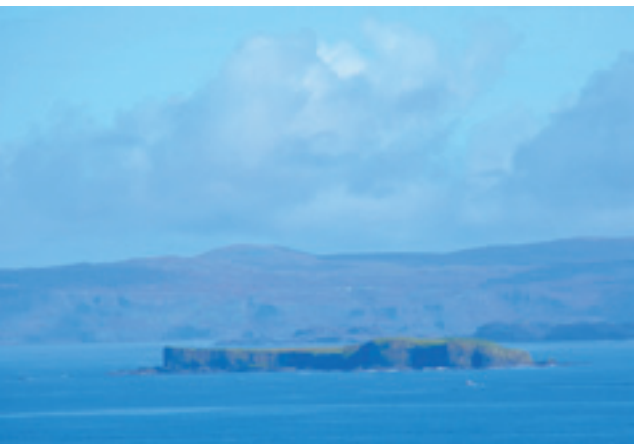
Staffa sett fra Dun I på Iona.

Under høstens reise til øya Iona 1 – et langt over tusen år gammelt senter for keltisk kristendom og druidevisdom på vestkysten av Skottland – og hvor det under oppholdet ble arbeidet daglig med Mikaelsskolens klassesimer, fikk vi også anledning til å besøke en annen sagaomspunnet øy – Staffa – noen kilometer lengre nord.