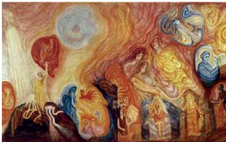
Rudolf Steiner hadde dekorert den vesle kuppelen i det første Goetheanum.

Slik står det i ein kladd. Han varierer emnet i mange brev, men utan siste setning. Og han skriv til alle kantar, til mor og far og sysken, til vener i Noreg og i Paris. Der går Henrik Sørensen, Jean Heiberg,