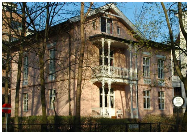
Oscars gt 10, Oslo.

De ansatte har ikke vært utsatt for ulykker eller skader i løpet av året. Sykefraværet har vært minimalt. Virksomheten forurenser ikke det ytre miljøet.