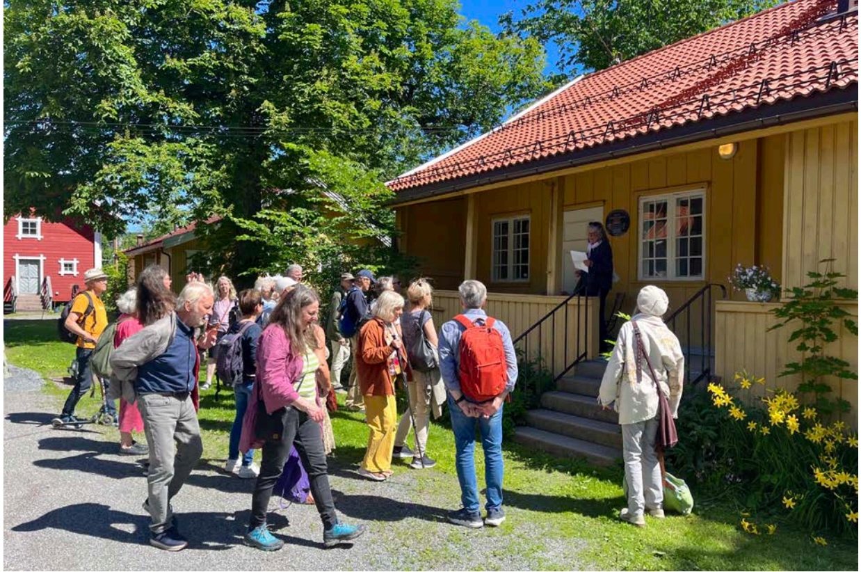
Bakkehaugen i Oslo hvor Hans Nielsen Hauge bodde fra 1811-1817. Se side 8.