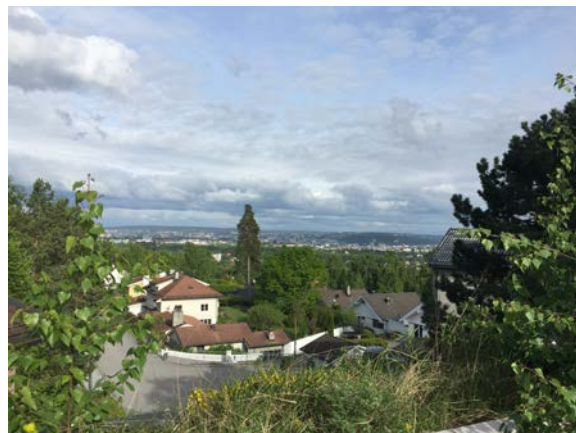
Huseby antroposofiske stiftelse i General Krohgsvei 17 på Montebello. Utsikt mot Oslo sentrum.