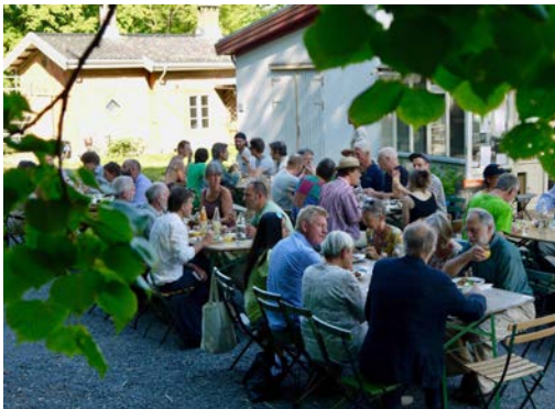
Gartneriet på Bygdø Kongsgård. https://bygdokongsgard.no/gartneriet/

ANTROPOSOFISK SELSKAP I NORGE – for mer informasjon, se http://www.antroposofi.no