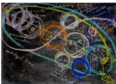
Taveltabling av Rudolf Steiner.

ANTROPOSOFISK SELSKAP I NORGE – for mer informasjon, se www.antroposofi.no