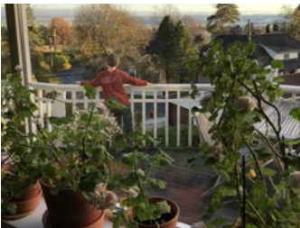
Boenhet i Melkeveien Oslo.