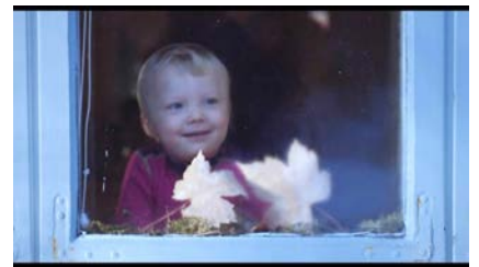
Margreth Olins film Barndom har vekket debatt i mange land . https://www.youtube.com/watch?v=GWoG51CAz44

subjective experience, thus pre-empting phenomenological thinkers such as Heidegger and Husserl in the 20th century. Named after the philosopher and educationalist Rudolf Steiner, the schools emphasise a delayed approach to formal instruction and instead prioritise hands-on, outdoor and arts-based learning.