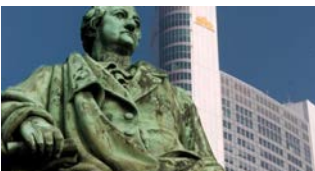
The Goethe monument Frankfurt. https://www.stadtmuseum-frankfurt.de/en/visiting-the-monument

Germany's giant of literature had a view of science that still appeals to many. He was deeply involved in the scientific debates of his day and even advanced his own theory of colours, opposing no less a figure than Isaac Newton. At the heart of his objection was a dislike of theories which reduced phenomena to something purely mathematical or mechanical. He believed knowledge was bound up with