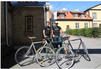
Retour i Storgata 36. http://www.retour.no

ANTROPOSOFISK SELSKAP I NORGE – for mer informasjon, se http://www.antroposofi.no