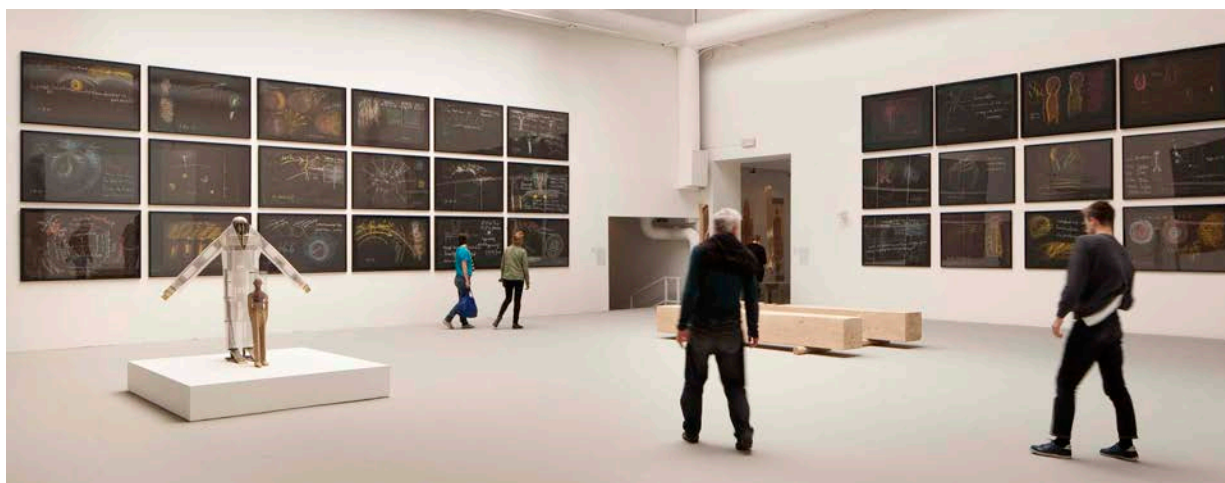
Rudolf Steiners tavletegninger på Veneziabiennalen i 2013.

Rudolf Steiners tavletegninger Wenn wir schlafen ble også vist på galleriet Artipelag utenfor Stockholm i siste del av 2013, noe som blant annet ble omtalt på kunstkritikk.no .