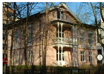
Oscars gate 10 i Homansbyen, Oslo.

Til sine møter og som kontoradresse benytter Dialogos lokalene til Antroposofisk Selskap i Norge, Oscars gate 10, 0352 Oslo. Styret anser at arbeidsmiljøet i virksomheten har vært godt. Foreningen har hatt to fast ansatte i deltidsstillinger til 1.9 og kun en ansatt i deltidsstilling etter det. De ansatte har ikke vært utsatt for ulykker eller skader. Sykefraværet har vært minimalt. Staben består av to kvinner, mens to menn arbeider på engasjementsbasis med henholdsvis regnskap og nettside. Styret har i 2013 bestått av 3 kvinner og 3 menn (inkl varamedl). Virksomheten forurensrer ikke det ytre miljøet.