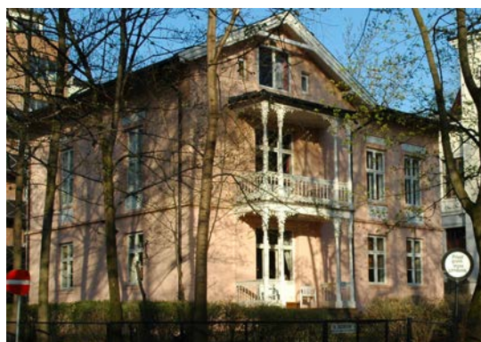
Oscars gate 10, i Homansbyen i Oslo.

Styret anser at arbeidsmiljøet i virksomheten har vært godt. Foreningen har hatt to fast ansatte i deltidsstillinger. De ansatte har ikke vært utsatt for ulykker eller skader. Sykefraværet har vært minimalt. Staben består av to kvinner, mens to menn arbeider på engasjementsbasis med henholdsvis regnskap og nettside.