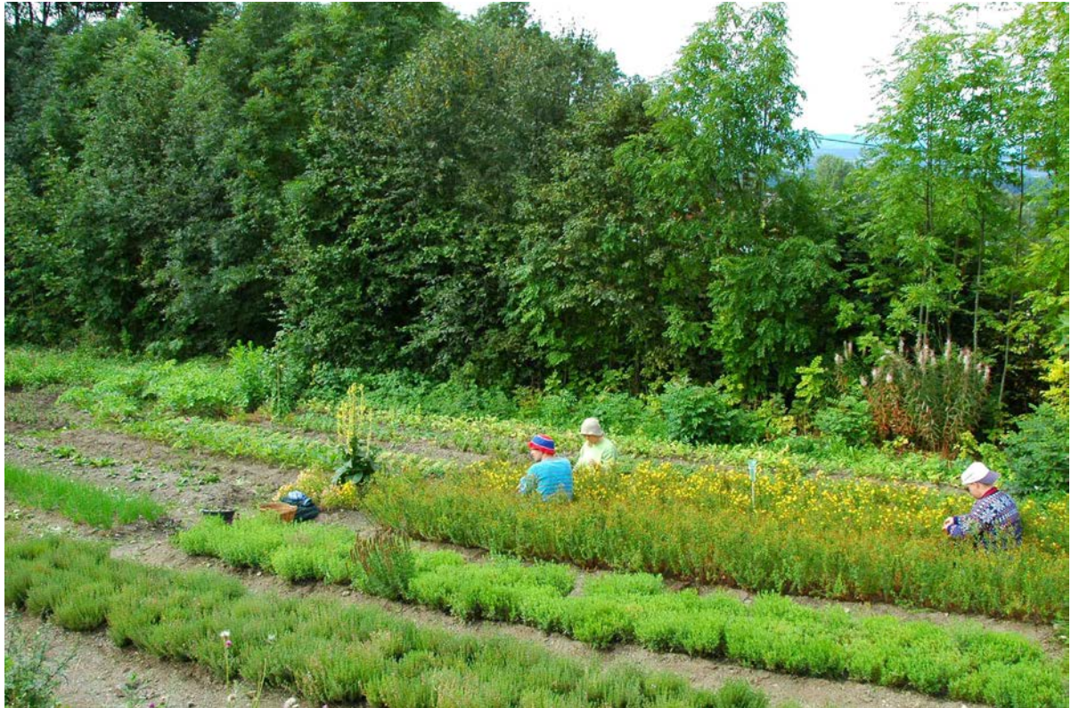
Iurtehagen på Solborg Camphill.