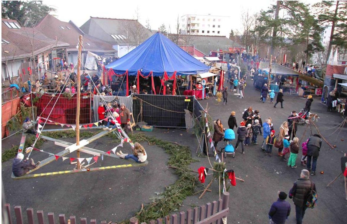
Julemarked Rudolf Steinerskolen i Oslo på Hovseter 2011.