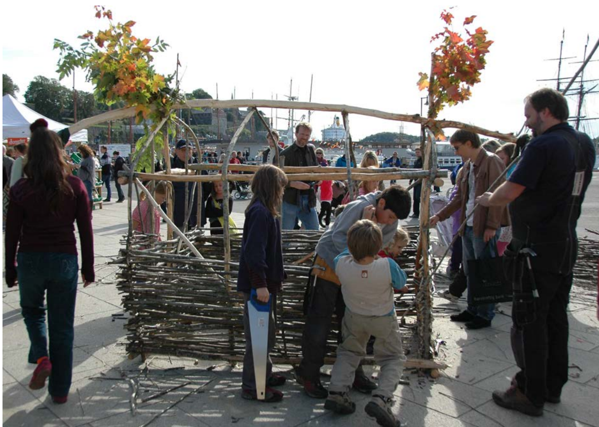
Et hus flettes på Rådhusplassen 2011 under arrangementet: Et levende mangfold – antroposofi i praksis.