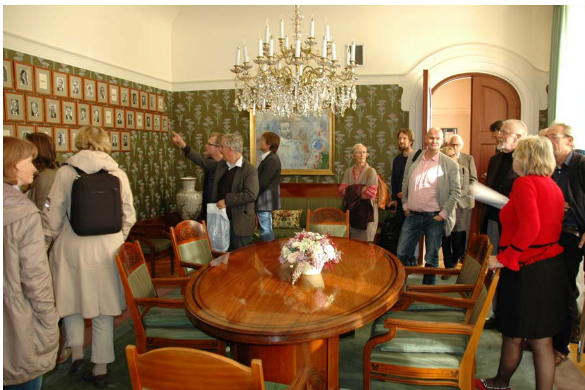
I Komiterommet i Nobelinstituttet henger portretter av de tidligere fredsprisvinnerne.

23.9 var det omvisning og foredrag med Cato Schiøtz i Nobelinstituttets store sal der Rudolf Steiner i sin tid holdt i alt 49 foredrag. Se foto fra omvisningen og vandringen i Det Antroposofisk kvartalet . http://www.antroposofi.no/fileadmin/ain/Fotobrev_Nobel_og_GL_2011.pdf