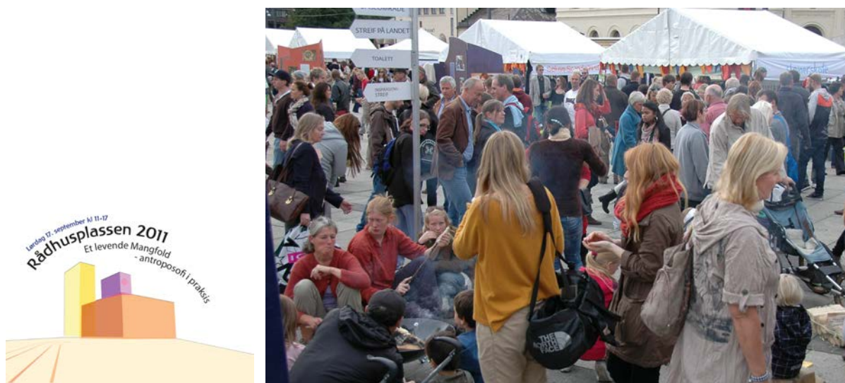
Mange mennesker oppsøkte markedet på Rådhusplassen 2011.