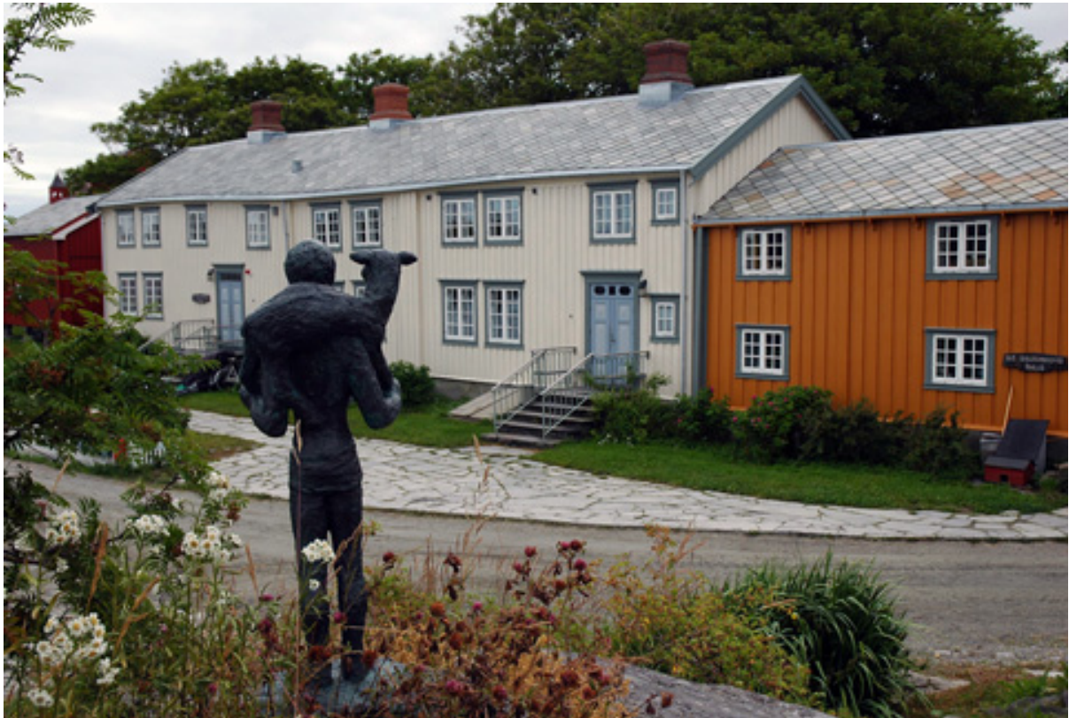
Det første fordypningsområdet Dialogos valgte var sosialterapi.