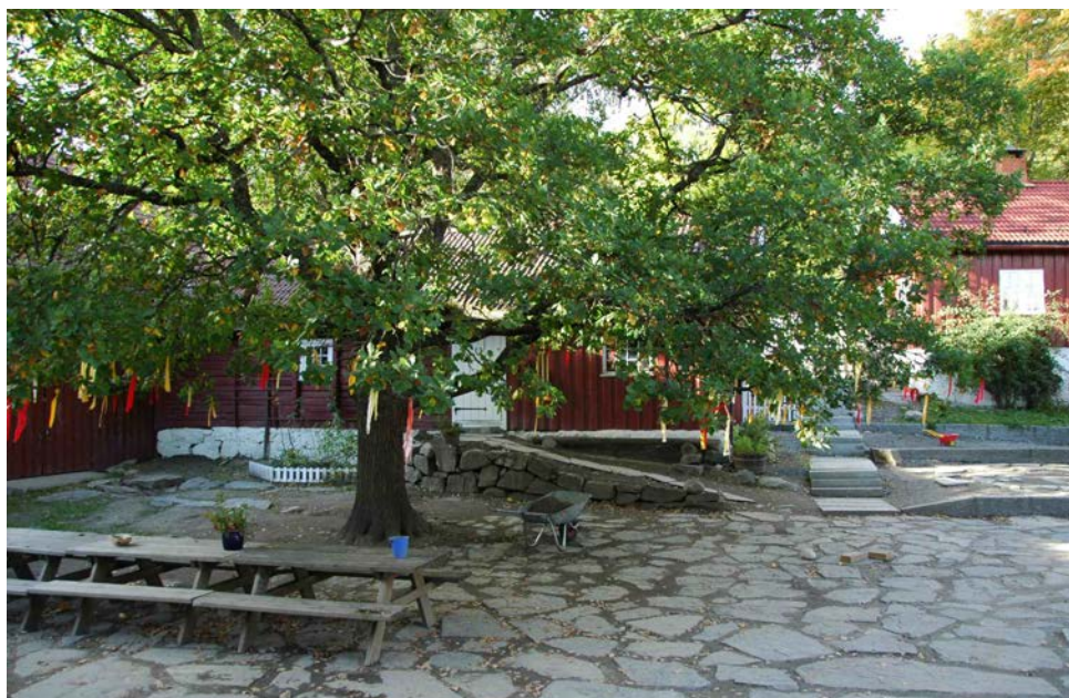
Tuntreet i Steinerbarnehagen på Nordstrand i Oslo.