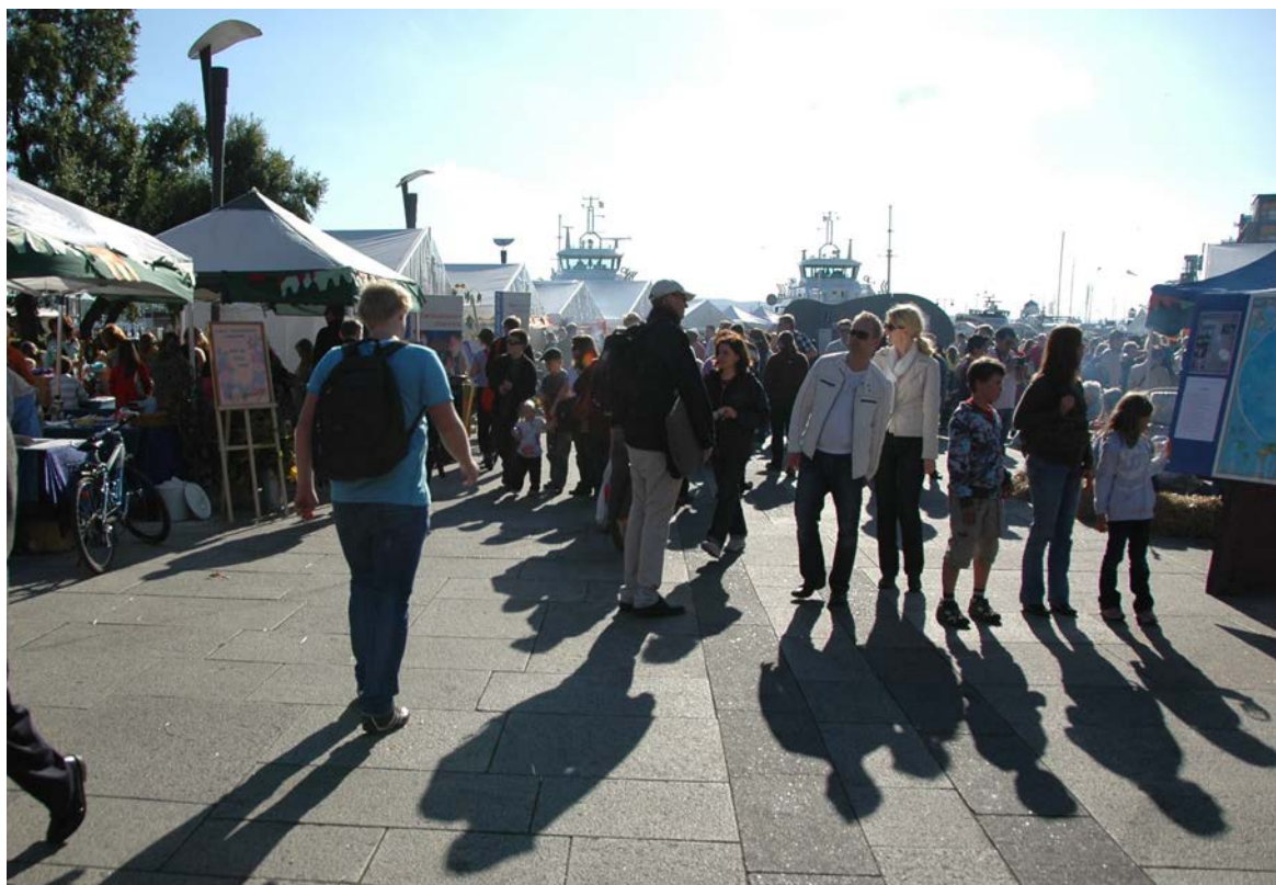
Mange mennesker oppsøkte markedet på Rådhusplassen.

Dialogos samarbeider med Antroposofisk Selskap i Norge om arrangementet, og det er også opprettet en Facebook-side for dette. 2010 ble kinofilmen Zwischen Himmel und Erde – Anthroposophie heute vist i forbindelse med markedet. Filmen portretterer syv personer med lang historie, på godt og vondt, i forhold til antroposofien, og gir et spennende bidrag til refleksjon om dens potensialer og utfordringer.