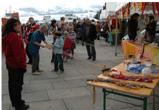
Hoppetaulaging Rådhusplassen 2010.