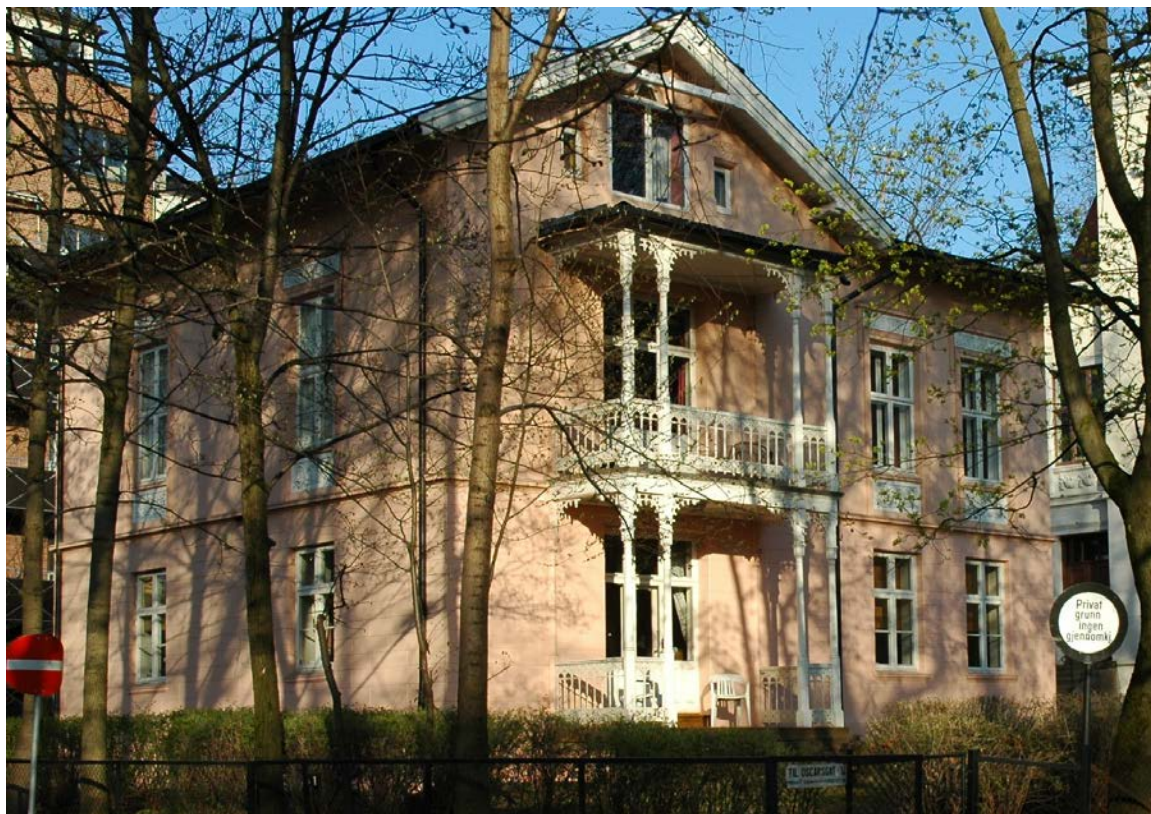
Dialogos holder sine møter i første etasje i Oscars gate 10, i Homansbyen i Oslo.