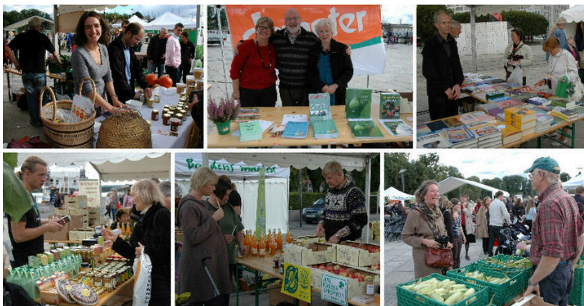
Fra markedet på Rådhusplassen 2010 – Et levende mangfold – Antroposofi i praksis.